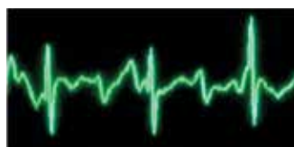
Gefiltertes EKG-Signal mittels See-Thru CPR