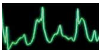
Ungefiltertes EKG-Signal während der CPR

Die X Series verfügt auch über das innovative, ZOLL-eigene See-Thru CPR®. See-Thru CPR filtert Kompressionsartefakte aus dem EKG heraus, sodass der zugrunde liegende Herzrhythmus des Patienten während der CPR angezeigt werden kann. Da der Anwender jetzt den zugrunde liegenden Rhythmus bewerten kann, können durch diese Technologie Kompressionspausen drastisch minimiert werden.